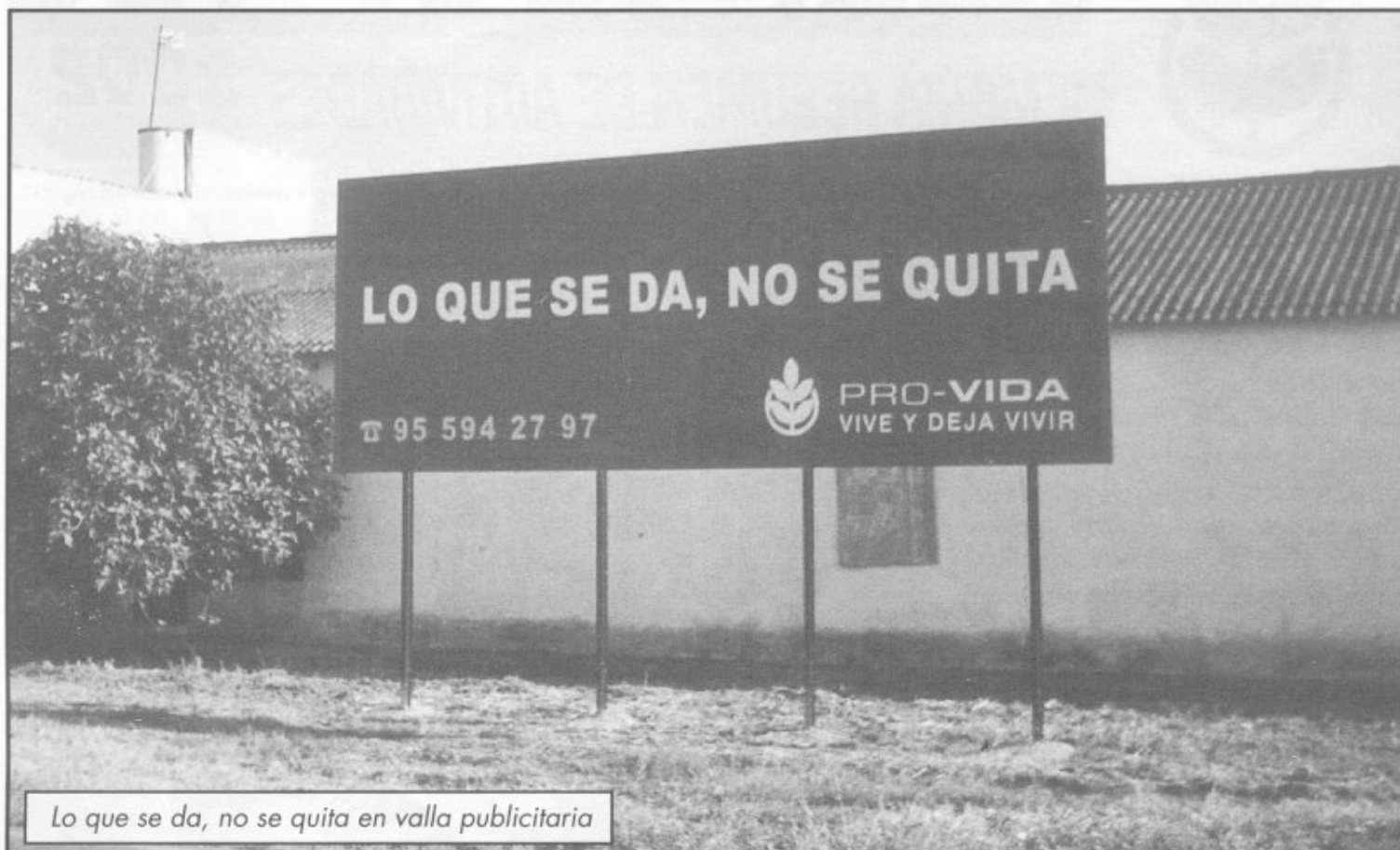
Lo que se da, no se quita en valla publicitaria

nacidos y no nacidos de la siguiente manera: Pañales, leche y otros alimentos 7.431,80 euros. Enseres y ropita 4.263,78 euros. Aportación a Manos Unidas para la campaña contra el hambre 760 euros. A Pro-Vida de Cuba 5.400 euros. Becas de estudio, asistenciales y especiales para madres 1.040,90 euros. Otros conceptos de acogida a la vida 167,82 euros.